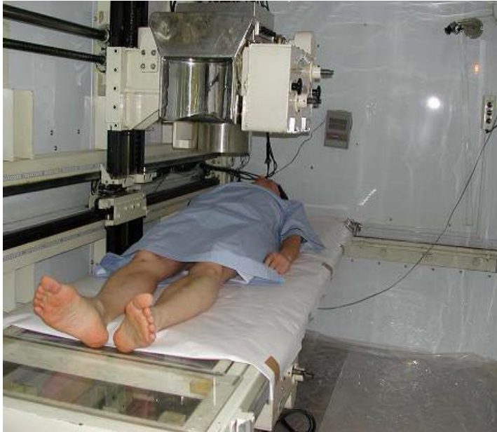
ホールボディ・カウンタ