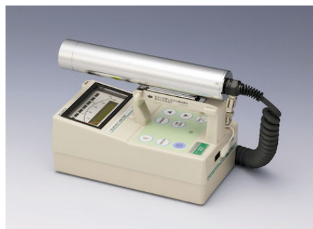
NaI (TI) シンチレーション式 サーベイメータ