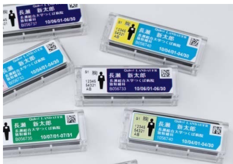
光刺激ルミネッセンス 線量計 (OSL)