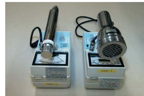
GM計数管式 サーベイメータ