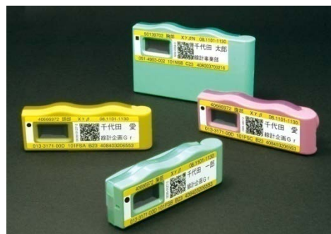
蛍光ガラス線量計