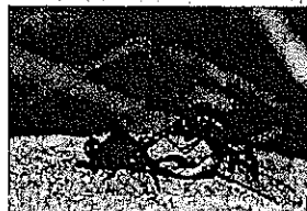
タイクリアカネ 交尾