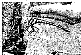
オオリボシヤンマ