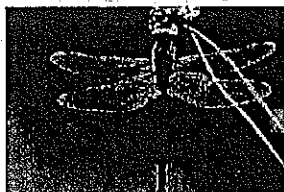
ホノミモリトンボ