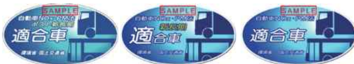
自動車 NOx・PM 法適合車ステッカー

なお、車種規制とは別に、埼玉県、千葉県、東京都、神奈川県、大阪府及び兵庫県では条例により独自の規制を行っています。各都府県の条例による規制の内容につきましては、各都府県にお問い合わせください。