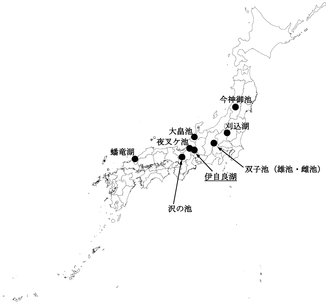
陸水モニタリング地点