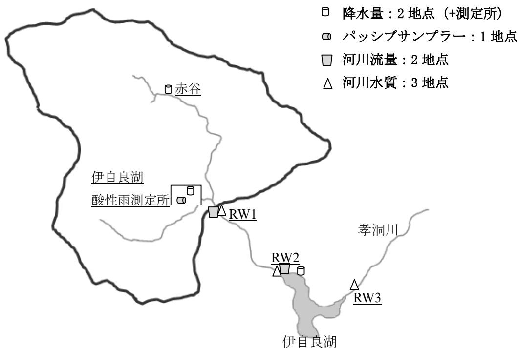
伊自良湖集水域モニタリングにおける調査地点