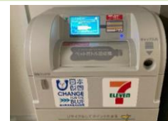
合同庁舎5号館内のPETボトル回収機

プラスチックごみをはじめ庁舎等から排出される廃棄物の 3R + Renewable を徹底し、 サーキュラーエコノミーへの移行 を総合的に推進する。