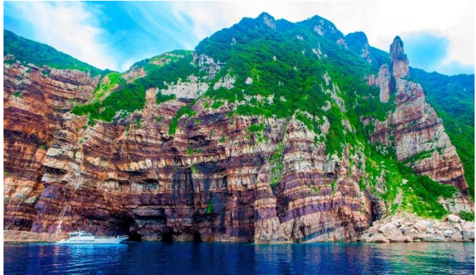
8,000 万年前の地層・鹿島断崖

甌島は、鹿児島県薩摩半島の西方約 26 km の東シナ海上に位置し、北東から南西方向に上甌島・中甌島・下甌島と約 35 km に 3 つの有人島を中心に形成されている列島であり、8000 万年前の姫浦層群の地層が剥き出しになっている鹿島断崖、陸繋砂州（トンボロ）や 3 つの池と東シナ海とが砂州で区切られた天然記念物の長目の浜など、多様な自然海岸を有する陸域と海域を中心とし、「太古の地球を感じる宝の島」をテーマに、平成 27 年 3 月 16 日に国定公園に指定されました。