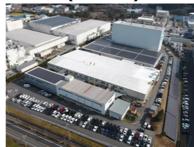
岡山第一工場の 太陽光発電施設 (873kW)