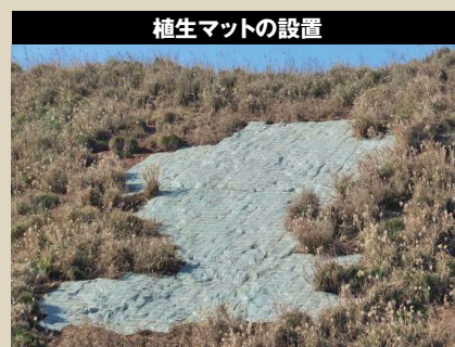
植生マットの設置