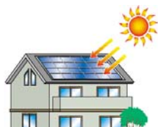
設備(例：太陽光発電システム)