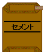
公共工事(例：資材：混合セメント)