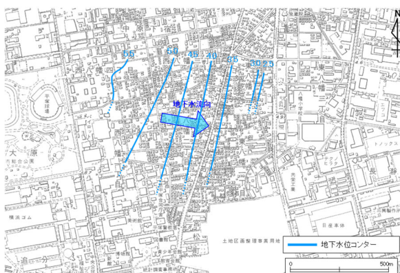
図2-3 地下水の流れと地下水位等高線 夏季：令和2年8月測定 (地下水位等高線の単位：標高m)