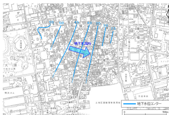
図2-2 地下水の流れと地下水位等高線 春季：令和2年5月測定 (地下水位等高線の単位：標高m)