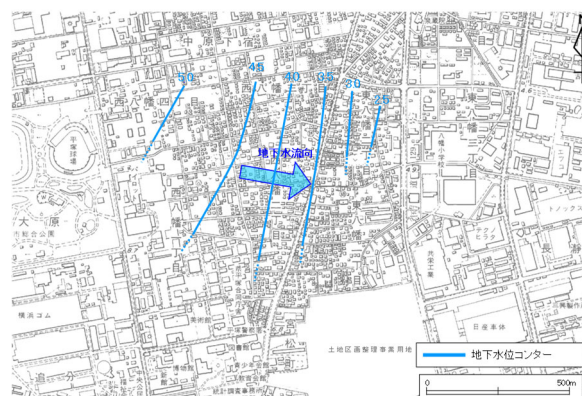
図2-4 地下水の流れと地下水位等高線 秋季：令和2年11月測定 (地下水位等高線の単位：標高m)