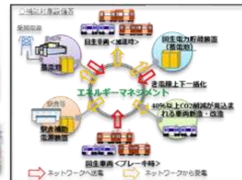
鉄道事業等の省CO2化

お問合せ先： 地球環境局地球温暖化対策事業室： 0570-028-341 水・大気環境局 自動車環境対策課： 03-5521-8303