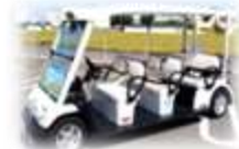
グリーンスローモビリティ（※）