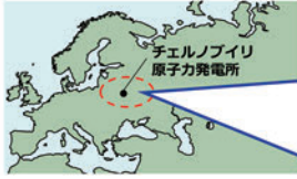
チェルノブイリ 原子力発電所