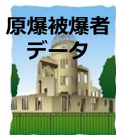
広島・長崎原爆被爆者における白血病の線量反応