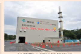
楢葉町の仮設焼却施設 (平成28年10月)