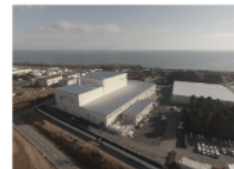
大熊町の仮設焼却施設(平成29年12月)

対策地域内廃棄物処理計画（平成25年12月26日一部改定）に基づき、災害廃棄物等の処理を実施中。