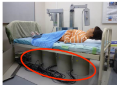
全身臥位型 ホールボディ・ カウンタ