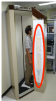
全身立位型 ホールボディ・ カウンタ