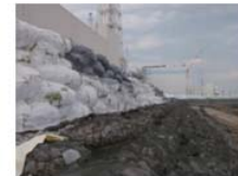
仮設防潮堤

津波が到達しない海拔高台エリアに電源車等のバックアップ電源や、消防車等の注水手段を用意しています。