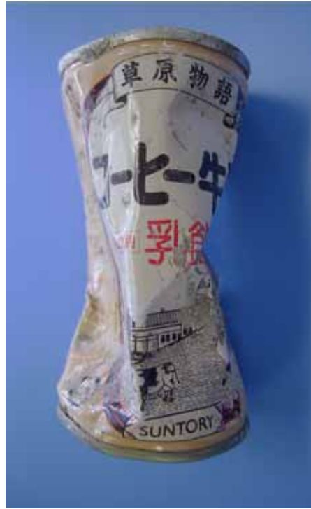
塊 -1 内部の飲料用缶