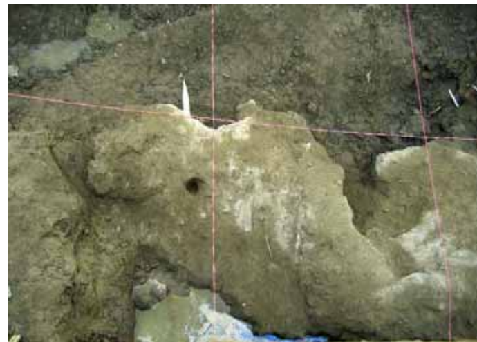
塊 - 2 の木杭 (NO.123 観測孔跡付近)