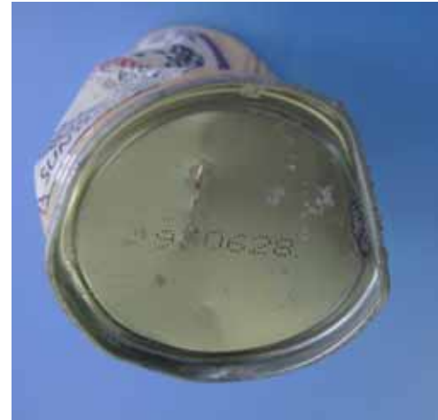
製造年月日 1993年6月28日