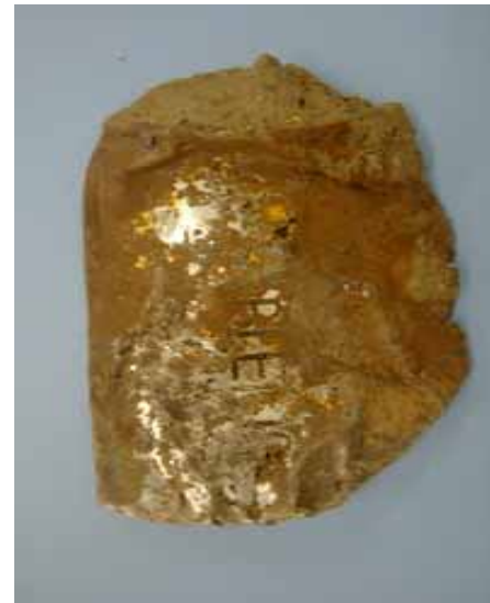
(コア抜き作業によりカットされている。製造年月は不明)