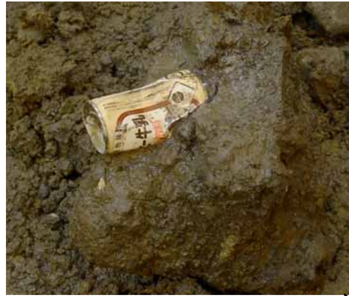
塊 -1 内部の飲料用缶 (解砕時に発見)