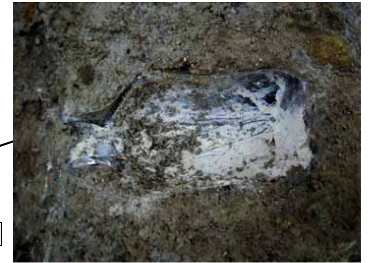
塊 - 3 下部中の白色粉の入ったガラス瓶 (解砕時に発見)