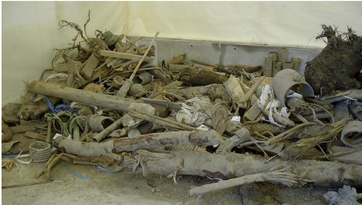
粗大出土物（洗浄前）