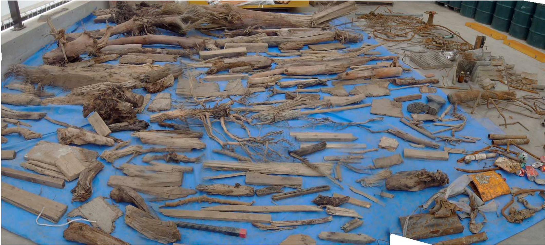
木片・金属類（洗浄後）