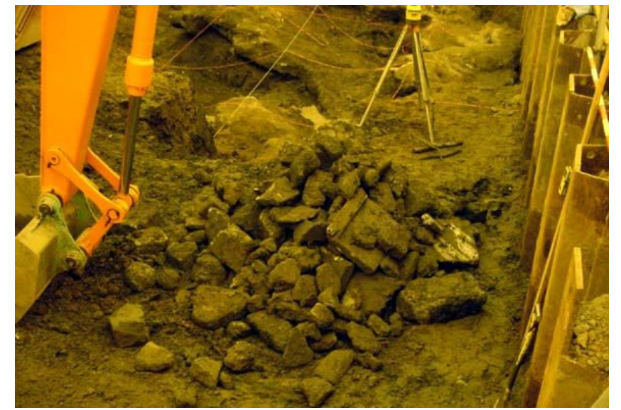
コンクリート、アスファルトガラ