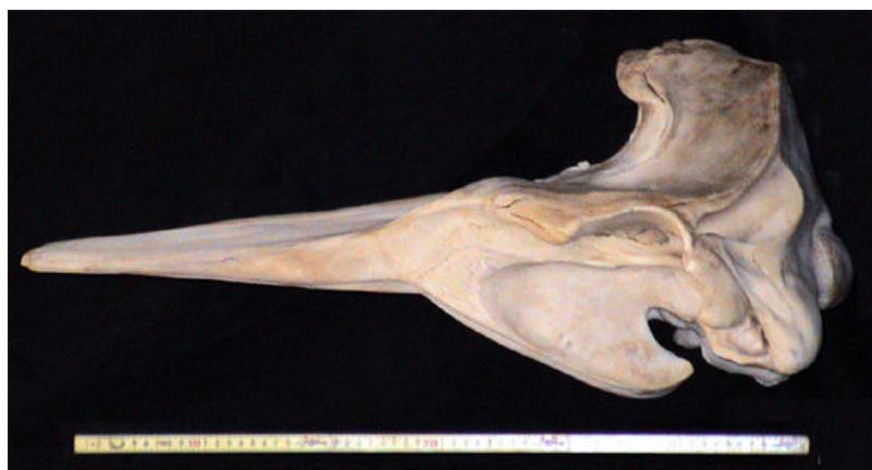
写真 2-2-6 オウギハクジラの頭骨標本(側面観)