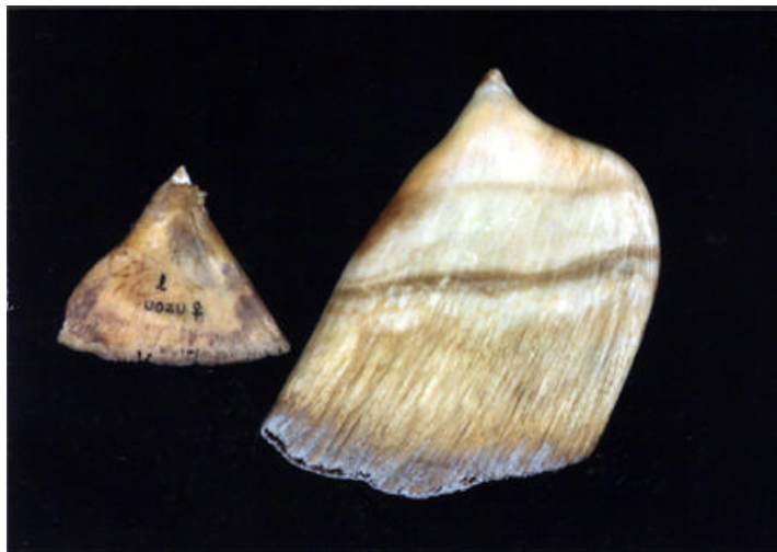
写真 2-2-4 オウギハクジラの雌成体（左）と雄成体（右）の歯の形状