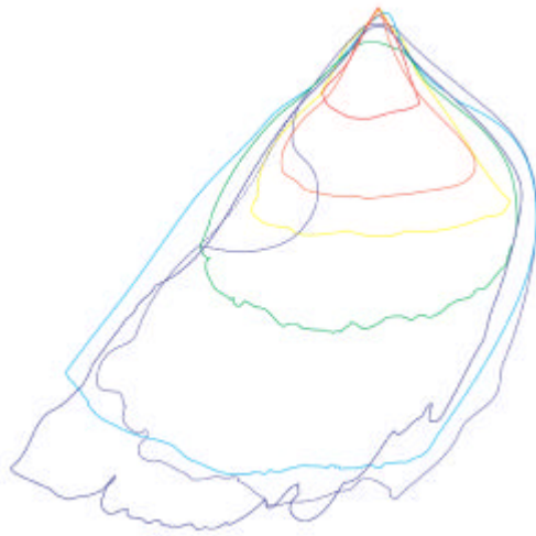
図 2-2-8 オウギハクジラの歯の成長に伴う形状と大きさの変化