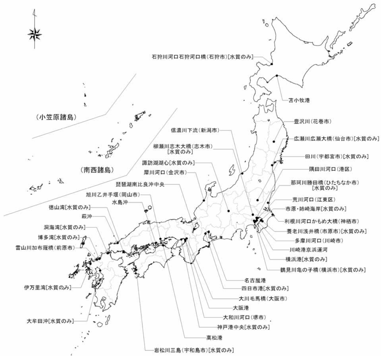
図1 平成21年度初期環境調査地点(水質・底質)