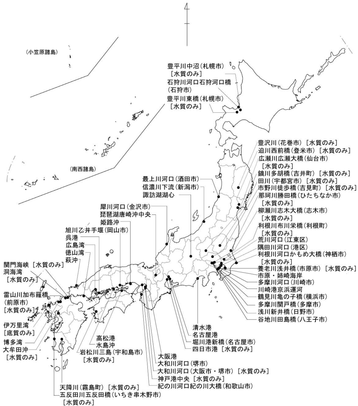
図1-1 平成19年度詳細環境調査地点（水質・底質）