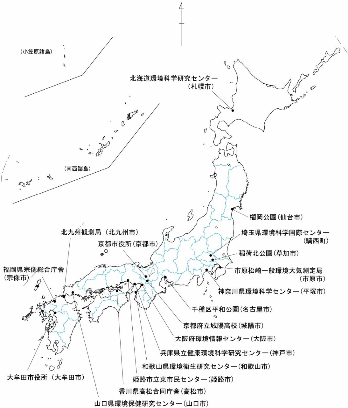
図3 平成18年度初期環境調査地点 (大気)