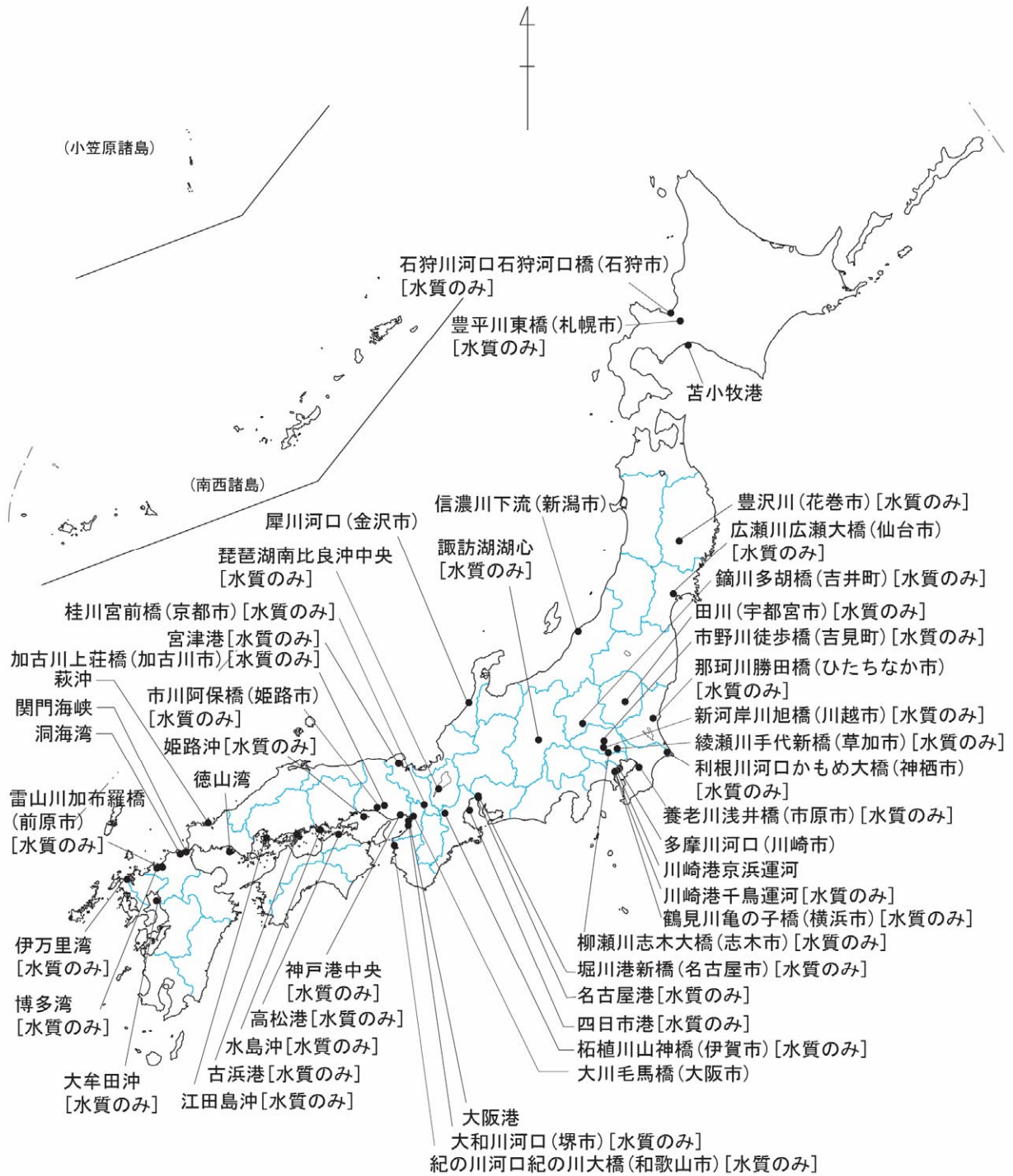
図1 平成18年度初期環境調査地点（水質・底質）