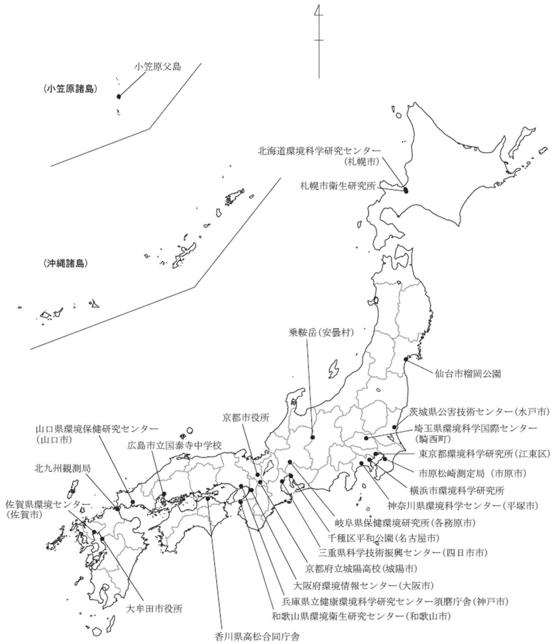
図1-3 平成16年度 初期環境調査地点 (大気)