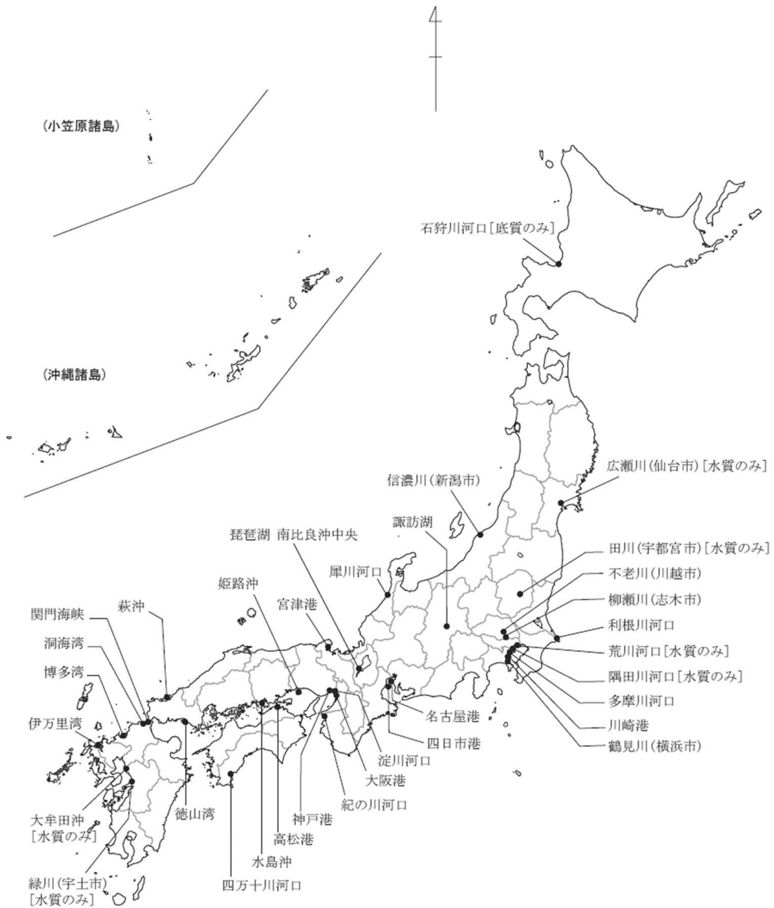
図1-1 平成16年度 初期環境調査地点（水質・底質）