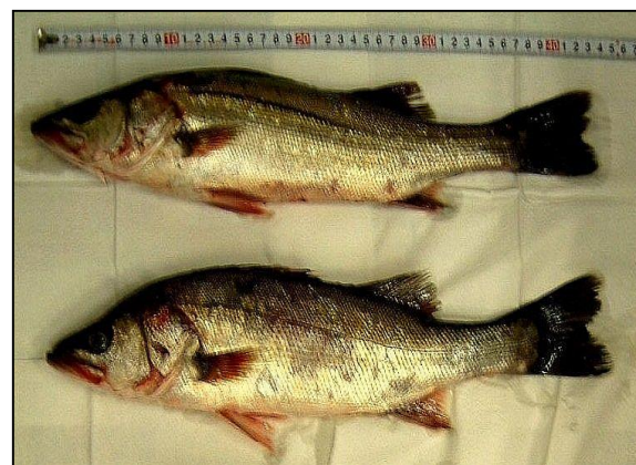
採取した水生生物試料（広島湾・スズキ）