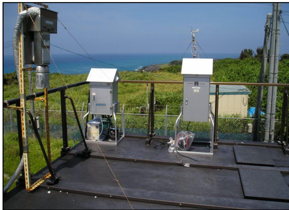
大気試料採取風景（沖縄県）