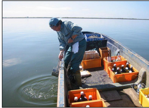
採水風景（秋田県八郎湖）