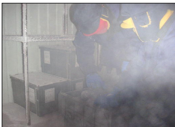
タイムカプセル棟内での作業風景