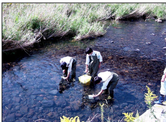
採水風景（鹿児島県五反田川）