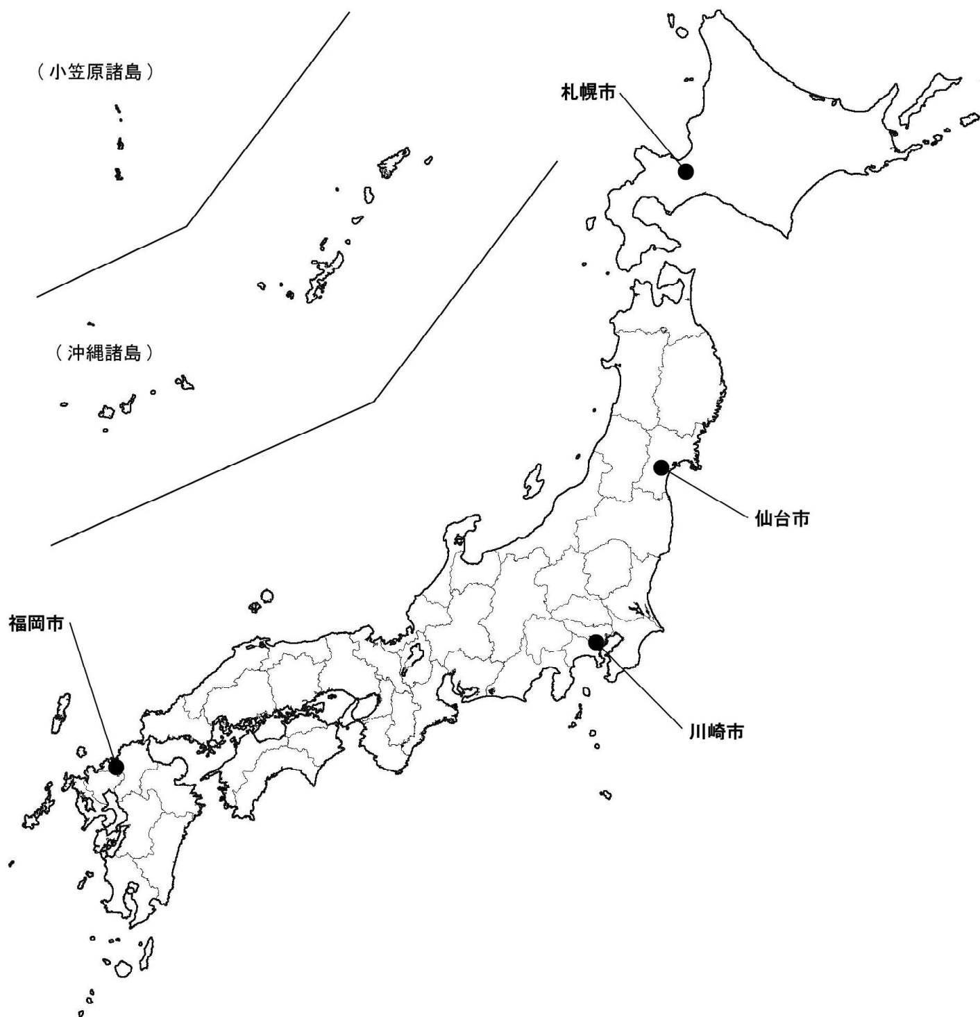
平成16年度 暴露量調査地点 (室内空気)