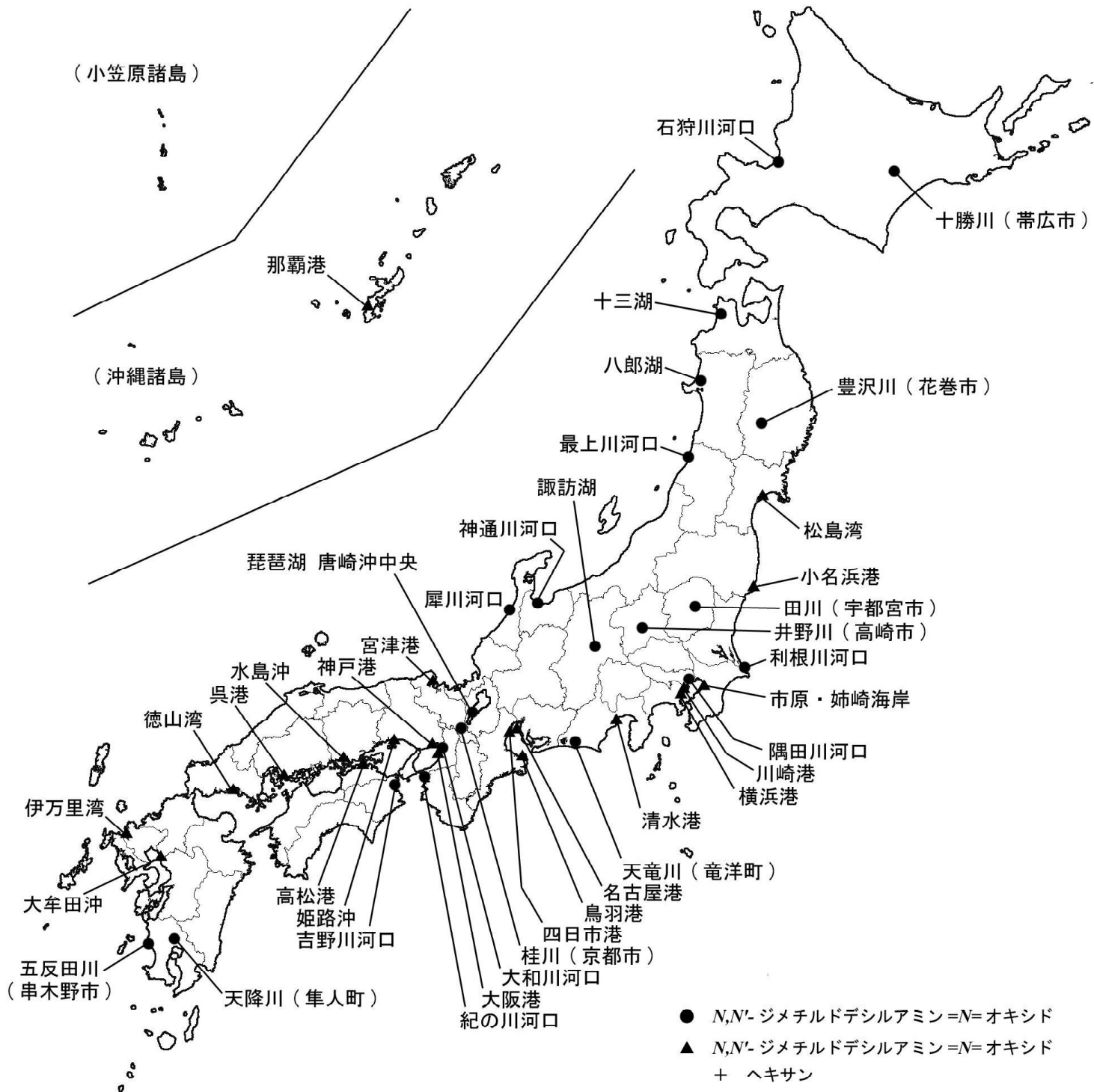
平成16年度 暴露量調査地点（水質）