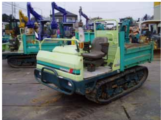
遊歩道で使用する運搬車

運搬車通行のため、遊歩道入口で拡幅を実施 遊歩道は路面整正、障害物の除去を実施 市道・遊歩道入口で交通誘導員を配置