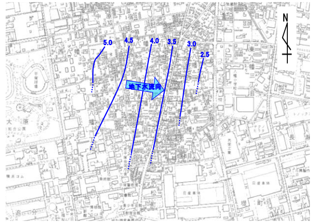
図 2. 地下水の流れと地下水位の等高線 平成 22 年 8 月測定 (地下水位等高線の単位：標高m)