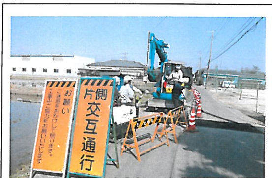
下水道放流管敷設箇所（市道 8-1353 号線）