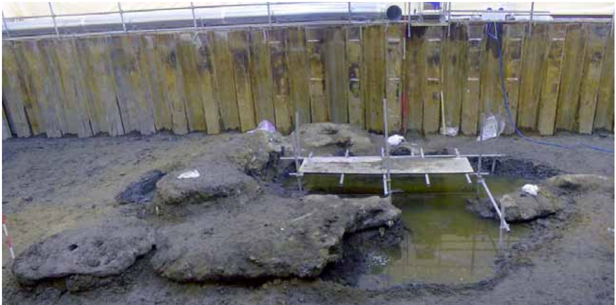
東西10m×南北8m×深さ2mのコンクリート様の塊

また、検討会での決定を受け、同日夕刻に中央公民館において住民説明会を開催しました。その際に、巨大なコンクリート様の塊が出てきたこともあり、掘削調査が年度末には終わらない見通しになったことをご説明しました。掘削調査区域については、掘削作業は4月～5月には終了し、夏には仮設物の撤去も含め作業を終了する予定です。一方、汚染土壌の処理については、昨夏の掘削計画策定時より、企業提案を公募して処理方法の検討を進めてきておりますが、現時点では、まだ処理方法は検討中です。まずは汚染源の掘削を優先して取り組んできておりますが、早急に処理方法を決定するべく検討してまいりますので、御理解のほどお願い申し上げます。