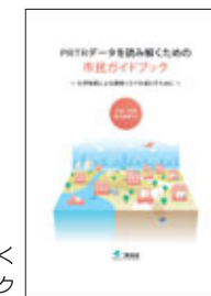
PRTRデータを読み解くための市民ガイドブック

※副読本として、下記のパンフレット等をご提供します。ただし、数に限りがありますので、その都度事務局にご確認ください。