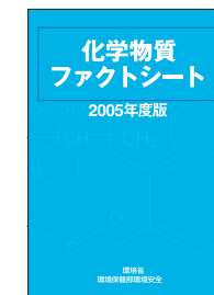
化学物質ファクトシート