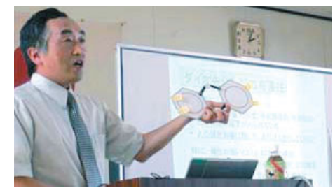
化学物質アドバイザーの説明風景