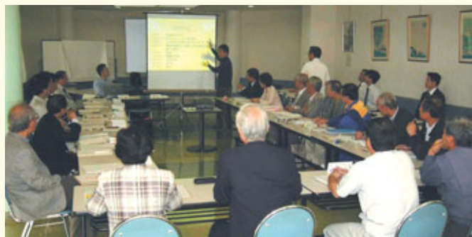
リスクコミュニケーションのひと幕

意見交換などを通じて意思疎通と相互理解を図ることで、事業所の日常的な操業に関することや、化学物質による具体的な問題について、事業者と市民だけでなく地元の行政も交えて情報を共有し、意見交換を行って、相互理解を深めましょう。