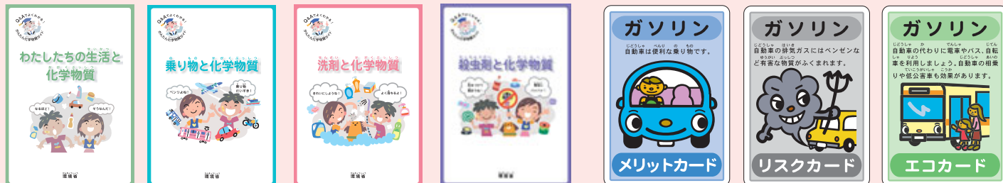
かんたん化学物質ガイドシリーズ

環境省では、お子さんにも化学物質を分かりやすく解説する冊子やゲームを作成・提供しています。化学物質アドバイザーは、これらを使って化学物質について楽しく学んでいただく支援も行っています。