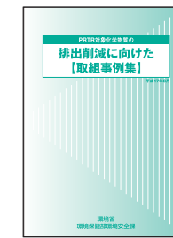
排出削減取組事例集