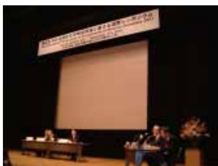
国際シンポの会場

内分泌攪乱作用については、そのメカニズムや化学物質との関わり の 解明、簡単な測定方法の 開発など、解明すべき部分や課題が山積しています。その対応には、国内関係省庁や関係機関と 連携するだけでなく、国際的に分担し各国が協力して調査・研究を進めることが重要です。