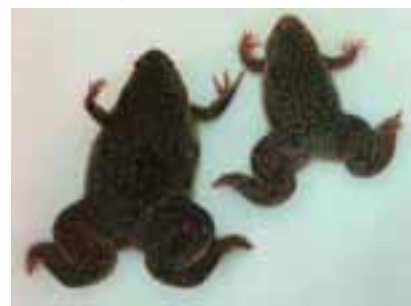
アフリカツメガエル