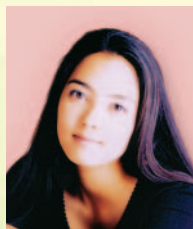
中山エミリ タレント