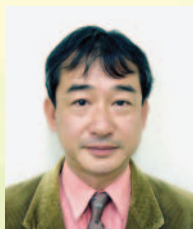
須之部友基 千葉県立 中央博物館