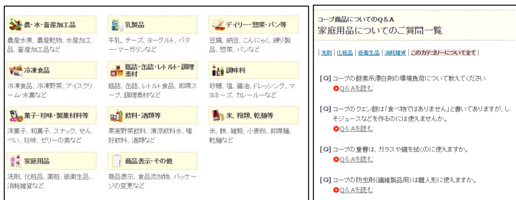
図-53 ビスフェノール A 問題についての Q&A

コープ商品についての消費者・組合員からよくある質問に答える形式で情報提供をしている。また、消費者の目線に立って、商品の分類ごとに Q&A が整理されているほか、「この時期によくあるご質問」や「よく見られているご質問」といったコーナーも設けられており、消費者が欲しい情報を見つけやすいよう工夫されている。例えば、家庭用品の項目を選択すると、防虫剤の用途や酸素系漂白剤の環境影響等に関する Q&A が掲載されている。