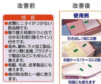
図-55 防虫剤の表示方法の変更