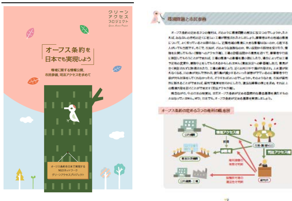
図-51 オフィス条約に関するパンフレット