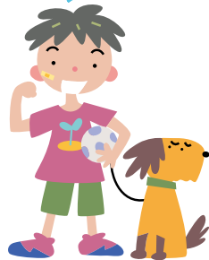
たろうくん ドリブル