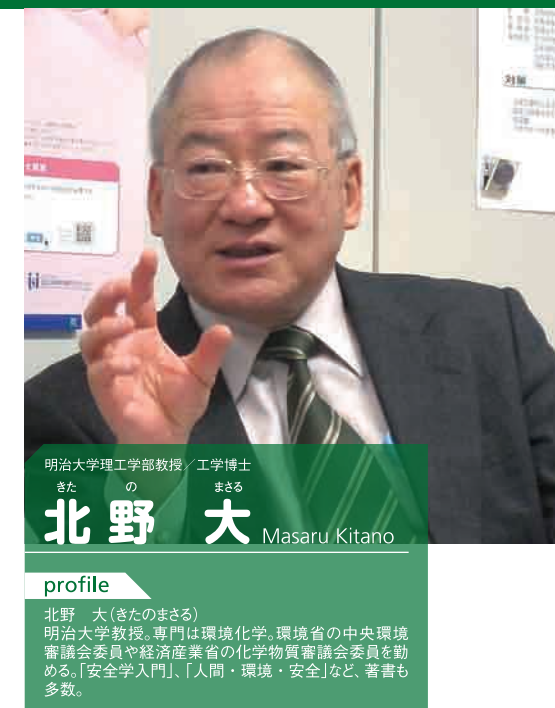
明治大学理工学部教授/工学博士 きたのまさる 北野 大 Masaru Kitano

「共助」という言葉がありますが、社会全体で子どもを育てていく、そういう社会を作っていきたいで