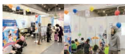
すくすく子育てフェスタ

九州市主催)が行われ、産業医科大学サブユニットセンターもブースを出展しました！チラシ・パンフレットの配布やエコチル調査の説明を多くの方に聞いていただくことができました。また、平成23年12月には「すくすく子育てフェスタ」(北九州市主催)にも参加し、エコチル調査の説明の他、写真撮影コーナー、エコチルぬりえ、オリジナル牛乳パックカレンダー作成など、多くのお父さんお母さんや子どもたちに楽しんでいただきました。ご来場いただいたみなさま、ありがとうございました。