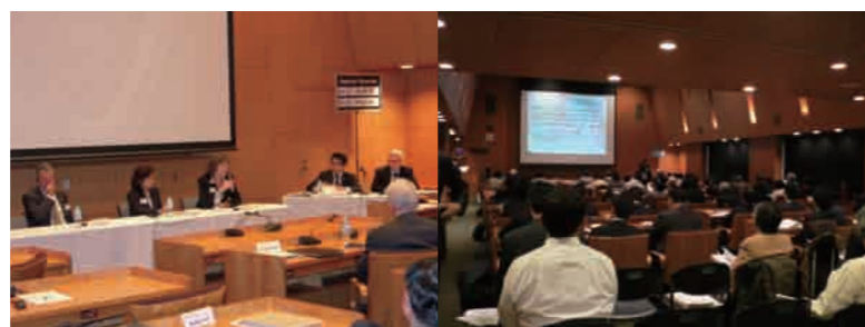
エコチル調査国際連携会議(平成23年2月)

※1：出生コホート調査…ある一定期間内に生まれた人口集団の変化を追跡して行く調査