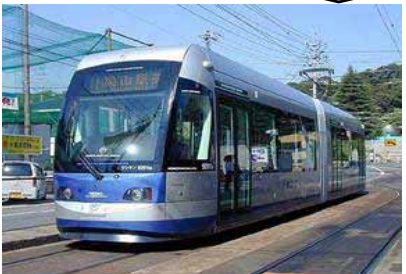
LRTプロジェクトの推進