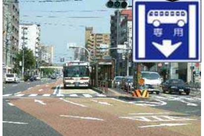
バス専用・優先レーン