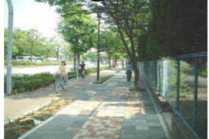
歩道、自転車道の整備