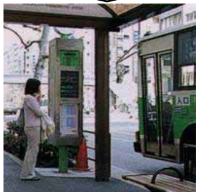
バスロケーションシステム