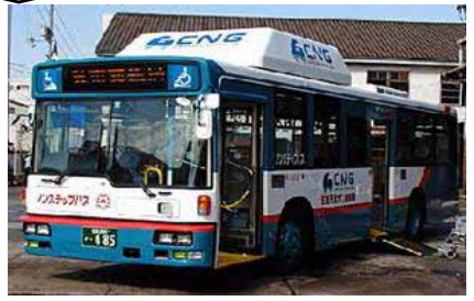
CNGバス等の低公害車の導入