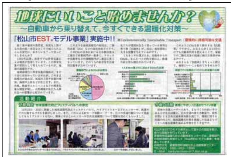
【ウィークリーえひめリック広告掲載】