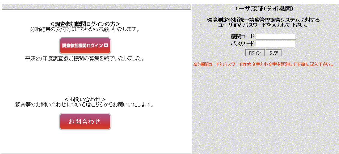
図 3-1.2 ログイン画面