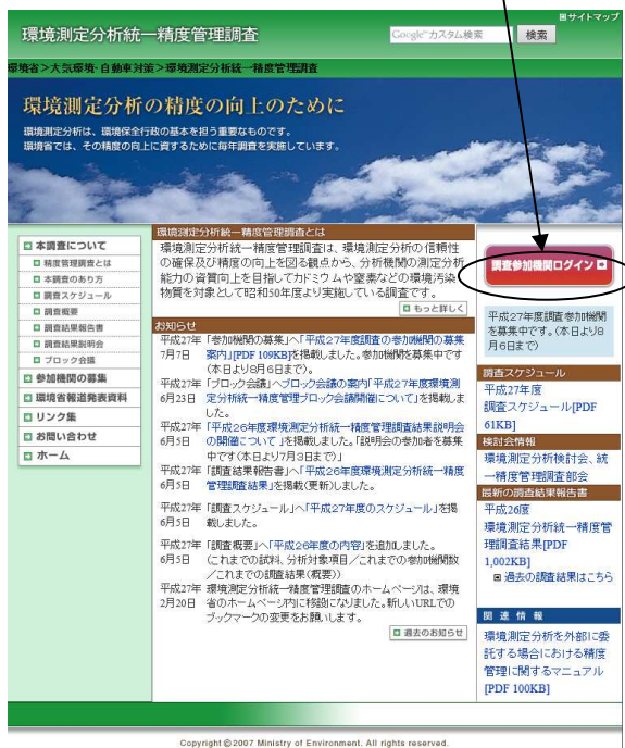
図 3-1.1 トップページ