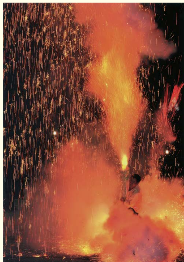
愛知県 新城市 「三郷神社・大人への儀式」