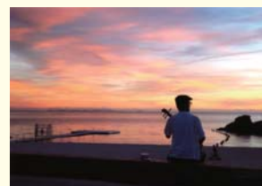
沖縄県 中頭郡北谷町 「島唄」