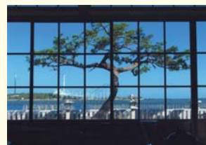
神奈川県 横浜市 「まちの流れを記憶する景色」