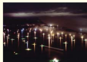
高知県 四万十市 「四万十光彩」