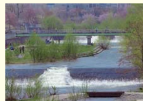
北海道 札幌市 「春の河畔公園」