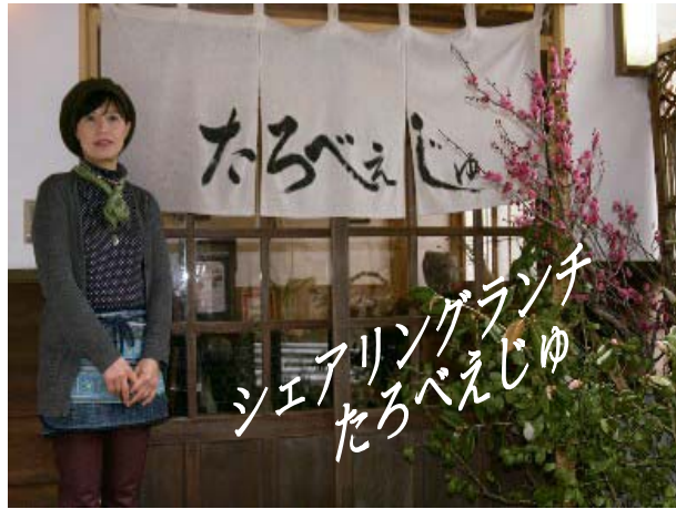
シェアリングランチ たろべえじゅ