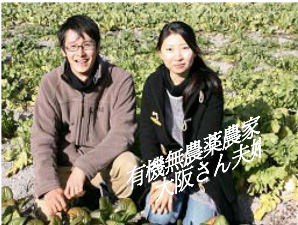
有機無農薬農家 大阪さん夫婦