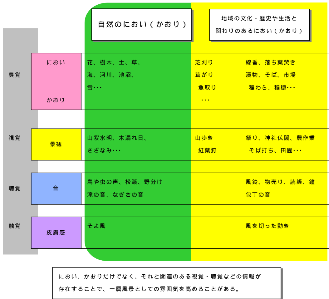
図 4-5 . 他の感覚環境要素との関連性を配慮したかおり設計のイメージ