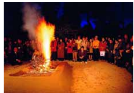
図 4-2. 須賀川牡丹園の牡丹焚火

所在地 ; 福島県須賀川市 かおりの源 ; 赤松、牡丹、枯死した牡丹古木の焚き火 季節 ; 11 月第 3 土曜日