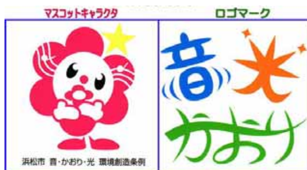
図4-8. 浜松市「音・かおり・光 環境創造事業」のマスコットキャラクター・ロゴマーク

第7条 市長は、市内に存する音・かおり・光資源のうち、市民の生活及び文化に深く根付き、広く市民に親しまれ、将来にわたり継承すべきと認めるものを、浜松市音・かおり・光資源として選定することができる。