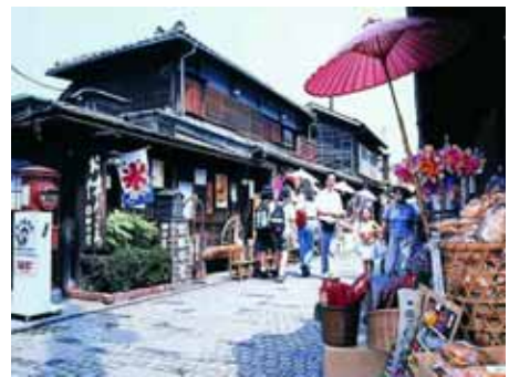
図 4-1. 川越の菓子屋横丁

所在地 ; 埼玉県川越市 かおりの源 ; ハッカ飴、駄菓子、だんご 季節 ; 一年中