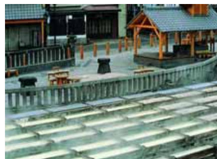
図 4-4. 草津温泉「湯畑」の湯けむり