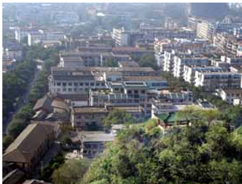
図 4-7．桂林市の街並み

( )面積；約4.1ha。キンモクセイやクスノキ、アラカシ等の高木約600本、ジンチョウゲ、アジサイ、コクチナシ等の低木約1万1,200本、ラベンダー、コモンタイム等7万6,000株余りが植えられ、様々な樹木や草花の香りを楽しみながら学習することができる。