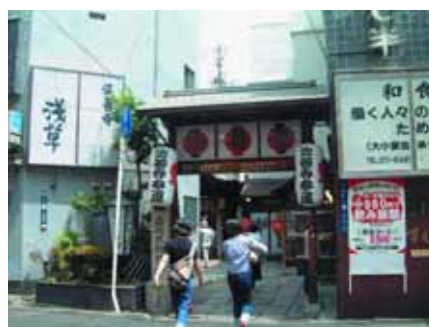
図 4-3. 法善寺の線香