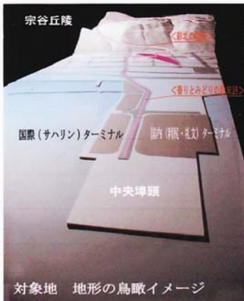
対象地 地形の鳥瞰イメージ

■樹木管理体制：桜守による桜の木カルテ制度の導入 / 1本毎に観察記録を残し / 市民及び企業による植樹及び管理を行います。