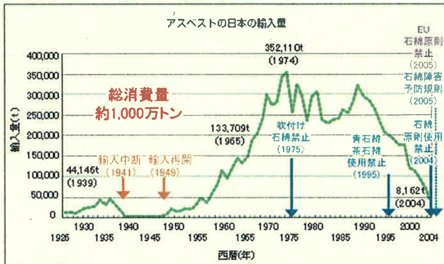
わが国の石綿輸入量の推移と法的規制の歴史

今後は、石綿が大量に輸入使用された1970年から1990年頃に建てられた建築物の老朽化に伴い、建築物の解体が増加することが懸念されることから、解体等の工事における石綿のばく露防止対策の一層の徹底を図ることなどから石綿に関して独立した規則として「石綿障害予防規則」が2005年7月に施行された。