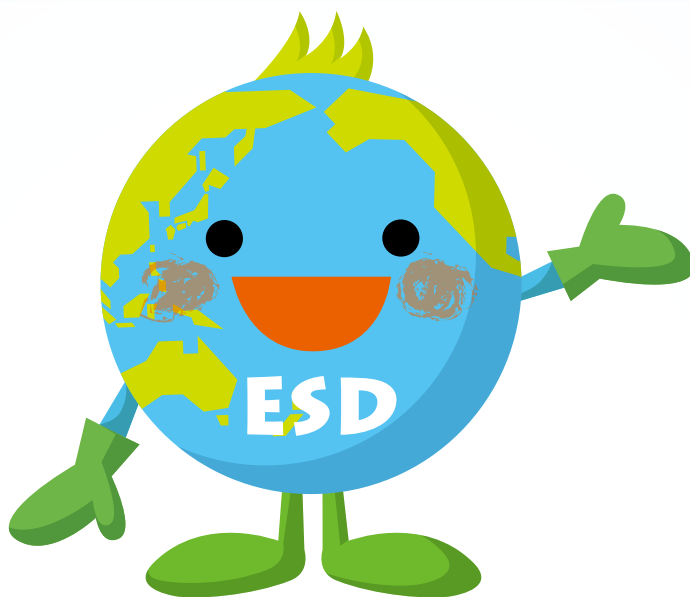
일본 환경성 ESD 캐릭터 “허그”

※ESD는 Education for Sustainable Development(지속가능한 발전을 위한 교육)의 약칭입니다.