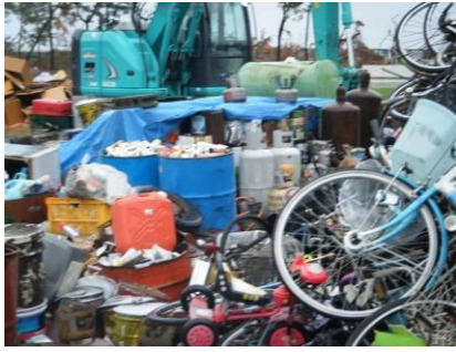
仮置場の分別状況(1)