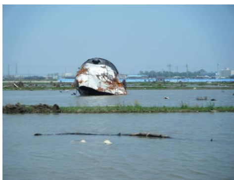
被災地の現況(1) (仮置場周辺地域)