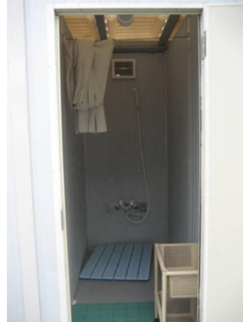
設置されたシャワールーム(写真左)とその内部(写真右)