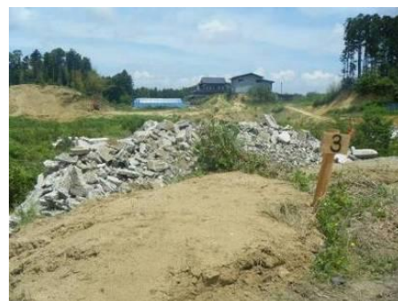
分別保管された屋根瓦(左)及びコンクリートガラ(右) (松島町)