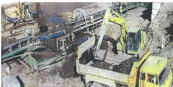
水槽分離施設での作業の様子

当該取組は、木くずの有効な選別方法として、災害廃棄物の現地での適切な選別作業に大きく貢献しました。