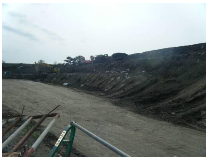
土壌改良され保管された津波堆積物

宮城県東松島市では、これまで市街地の側溝の津波堆積物の撤去について、関係者で役割分担（蓋上げは地区住民、清掃作業はボランティア、運搬は市が雇上した建設業者）をすることで進められてきました。今後、市は、土木業者と連携して、津波堆積物の性状調査、セメント添加(3%程度)による土壌改良試験、ストックヤードの確保を行うことにより、津波堆積物の埋戻し材としての有効利用の道を模索しています。