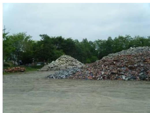
分別保管された屋根瓦(手前) (利府町)