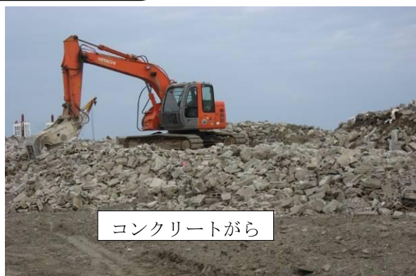
コンクリートがら