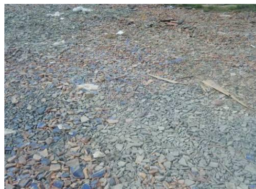
屋根瓦で覆われた仮置場敷地 (宮城県七ヶ浜町)