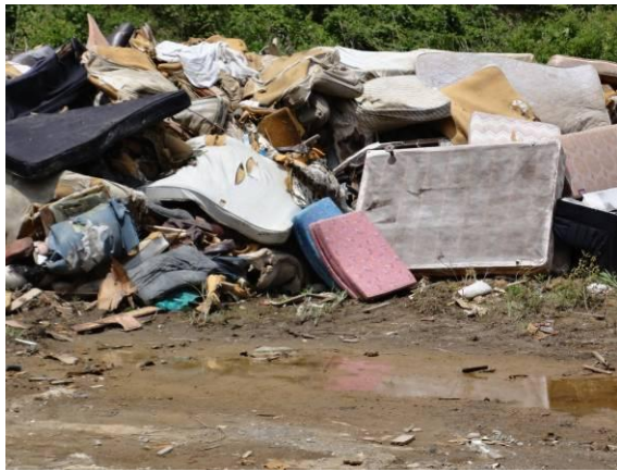
仮置場（マットレス）