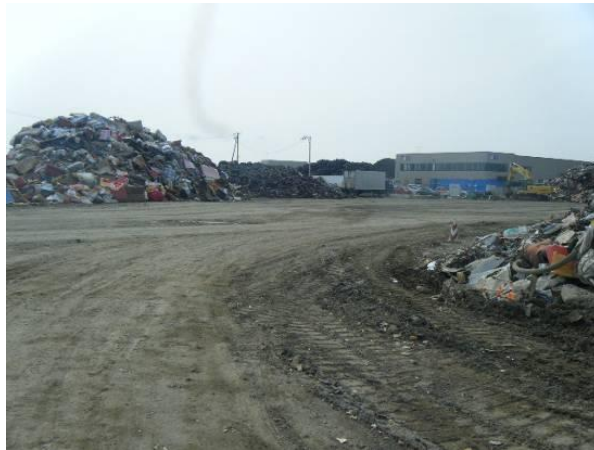
東松島市の自動車用タイヤの仮置場

宮城県東松島市では、仮置場における自動車用タイヤの搬出をほぼ毎日行い、保管期間を最小限に留めることにより、蚊の発生防止の取組を行っています。