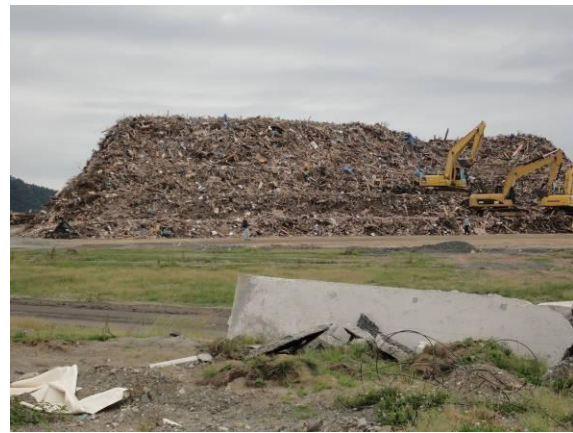
仮置場（野蒜地区）（木くず、積み上げが 高く、のり面の角度が急）