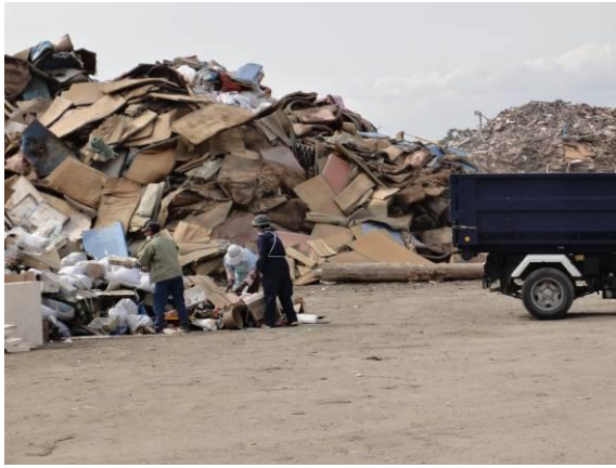
仮置場（大曲地区）（畳）