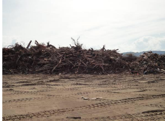
仮置場（山寺字矢来）（一部木くずを分別）