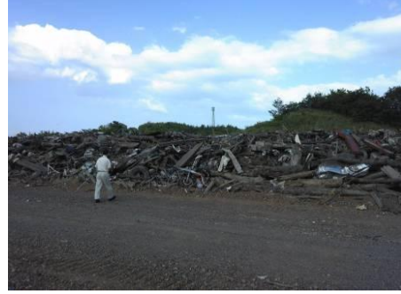
混合状態の災害ごみ