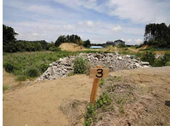
仮置場（コンクリート）