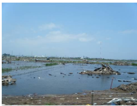
被災地の現況(2) (仮置場周辺地域)