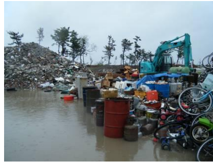
仮置場の分別状況(2)