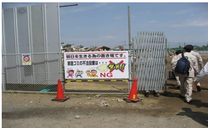
千葉県旭市仮置場ゲート入口の注意看板 不法投棄禁止の注意喚起