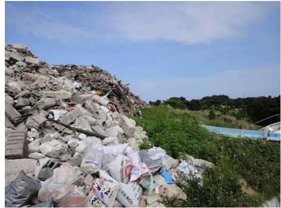
仮置場（積み上げが高く、のり面の角度が急）