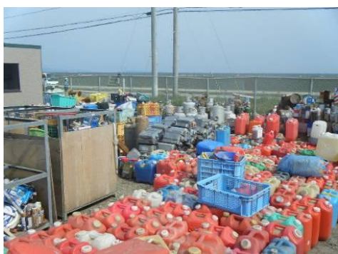
分別保管されたポリタンク(手前)、石油 ストーブ及び燃料タンク等(奥)(東松島市)