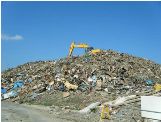
仮置場 1(気仙沼港付近)