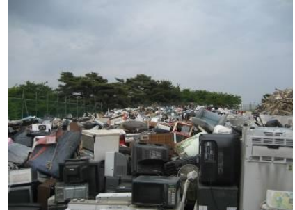
仮置き場状況(受入記録～木くず置き場～コンクリートガレキ～家電置き場)