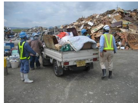
仮置き場搬入受入