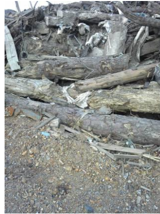
流木が非常に多い