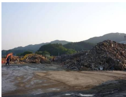
ヤード毎に確保された作業スペース