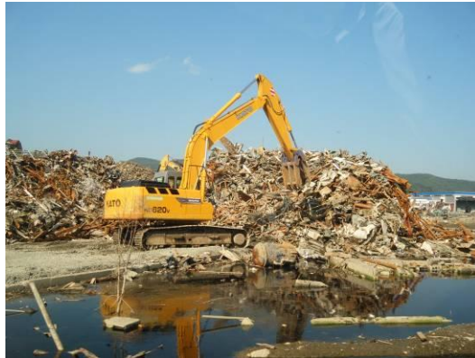
仮置場 2(気仙沼港付近)