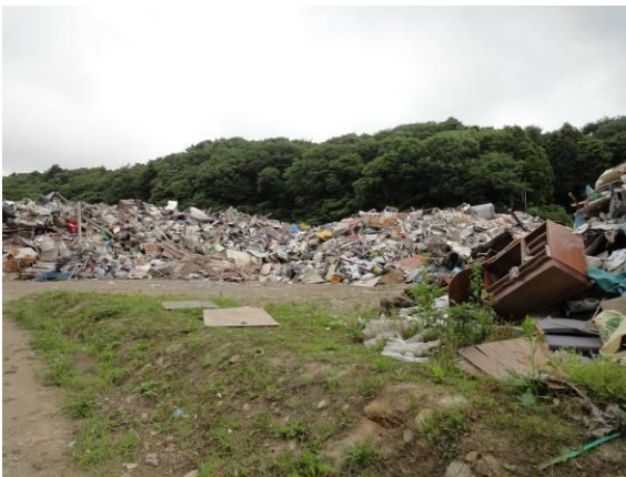
仮置場(中倉埋立処分場)(混合ごみ)