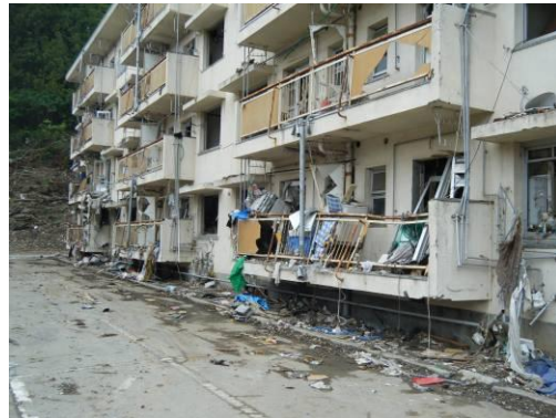
被災状況 2(町営住宅)

(2) 市街地全体が被災し、人は高台に居住している状況で、人が生活している地域ではガレキの撤去はほぼ完了している。半島や離島についてはまだ手つかずであるが、市街地のガレキの撤去が完了した後、半島、離島の順で作業を進めていく。半島では4月7日の余震で半壊となった家屋や漂着ごみもある。また、離島は船でガレキを運ぶことになるが港も被害を受けており、台船が着岸するためには浚渫が必要である。浚渫は来週から開始するのでガレキの撤去はそれが終了してからになる。 (3) 一次仮置場でのガレキの保管に当たっては、金属、コンクリート、家電、混合ごみに分けている。その他 PCB 廃棄物及び消火器を保管している。割合としては混合ごみが7割程度を占めている。