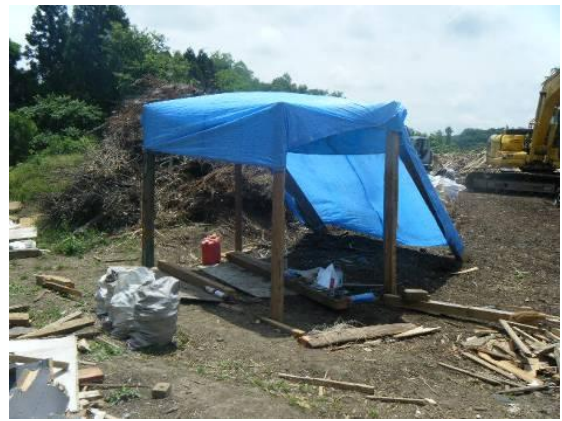
作業現場付近に設けられた休息所 (柱はガレキの一部を有効利用)