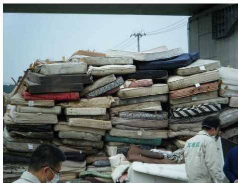
仮置場(マットレス)