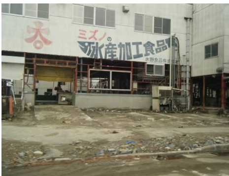
被災地の状況(水産業関連施設)

(1) ガレキの推計量は、約 616 万 3 千トン（環境省推計）と見込まれているが、自立していても今後解体されるものも見込まれるので市としては把握が難しい。