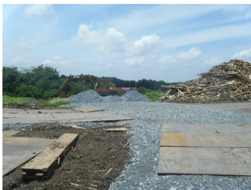
仮置場搬入路に敷設された砂利・鋼板 (宮城県松島町)

宮城県松島町では、仮置場の搬入路に鉄板や砂利などを敷くことにより乾燥時における粉じんの飛散を防止する取組がなされています。また、宮城県七ヶ浜町では、砕いた屋根瓦を仮置場敷地内に敷設して同様の効果を得ています。