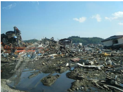
被災状況 1(気仙沼港付近)