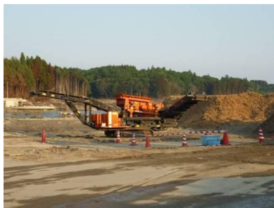
チップ化された廃木材 (山田町)