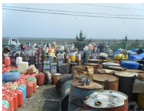
分別保管された塗料類(東松島市)