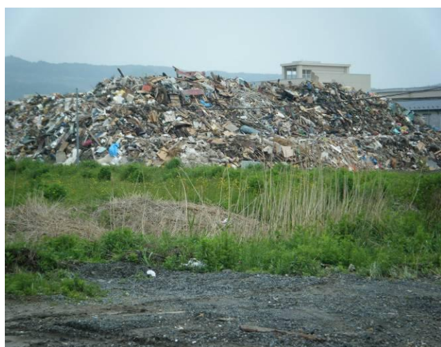
写真-1 石巻商高に近接して保管された混合ごみ