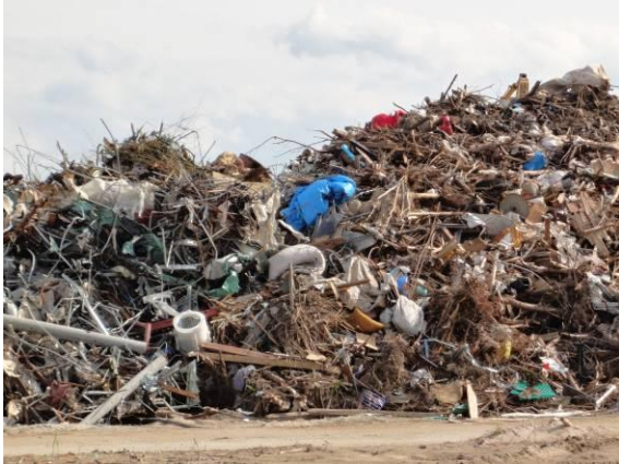
仮置場（山寺字矢来）（混合ごみ）