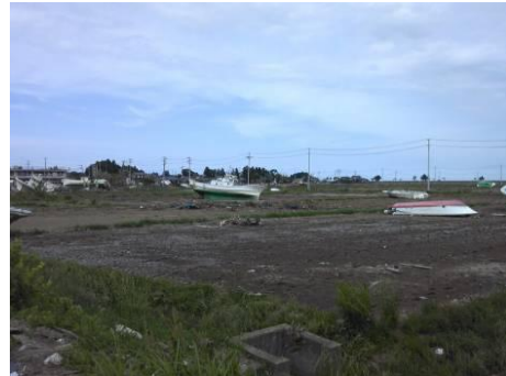
田んぼに取り残された船舶