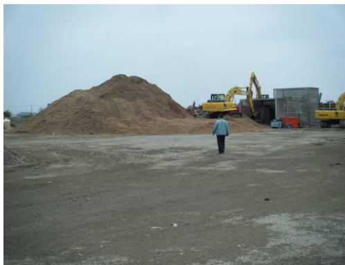
仮置場(木材チップ)