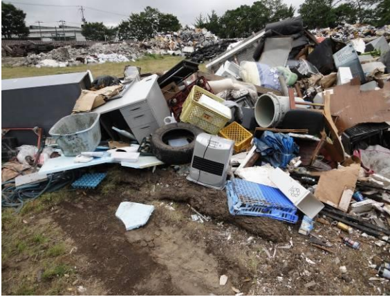
仮置場（新浜町公園） （混合ごみ、ストーブが含まれている）