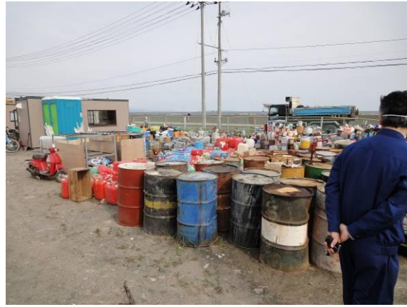
仮置場(大曲地区)(危険・有害ごみ)