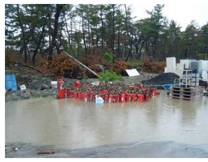
分別保管された消火器 (岩沼市)