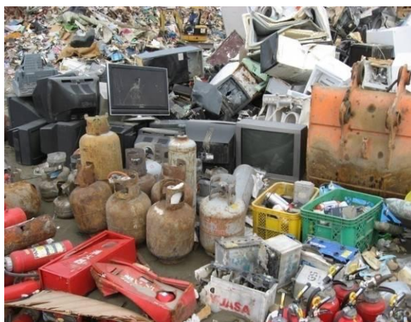
危険物（ガスボンベ、消火器類）