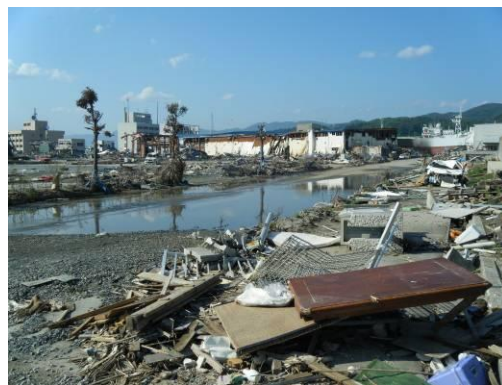
被災状況 2(気仙沼港付近)