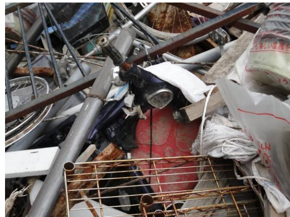
仮置場（中倉埋立処分場） （混合ごみ、バイクが含まれている）