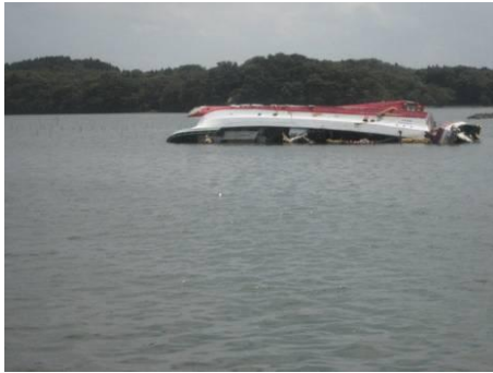
松川浦の残置船舶