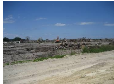
一次仮置場(新地駅前仮置場)