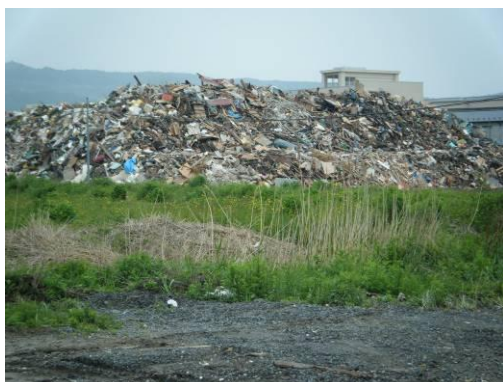
仮置場(混合ごみ) (背後の建物が高校)