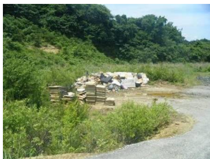
分別保管されたベットマット と畳(松島町)

宮城県松島町等では、処理困難物であるベットマット、畳などを仮置場で分別保管しています。また、宮城県名取市等では石膏ボードをフレコンパック等により分別保管しています。さらには、宮城県岩沼市等においては消火器、プロパンガスボンベ、カセットボンベ等を分別保管しています。宮城県東松島市では、石油ストーブや塗料類等を徹底して他のごみと分離し、石油ストーブは燃料タンクと電池を取り出して保管しています。