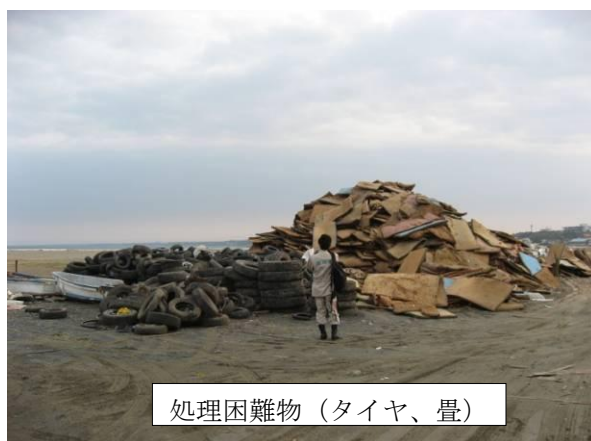
処理困難物（タイヤ、畳）