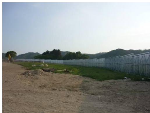
仮置場周囲に設置されたフェンス (岩手県田野畑村)