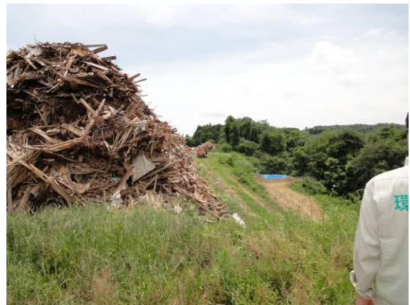
仮置場（森林組合）（木くず、積み上げ が高く、のり面の角度が急）