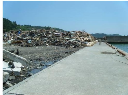
海岸の仮置場(浚渫ごみ含む)