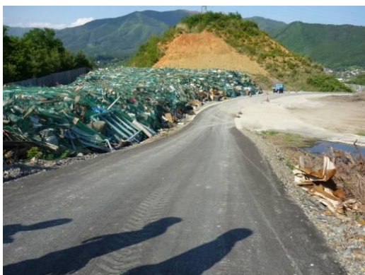
ネットで覆われた災害廃棄物 (岩手県大船渡市)

岩手県大船渡市では、紙ごみやプラスチックごみなどの敷地外への飛散防止を図ることを目的として、仮置場にフェンスを設置するとともに、保管された災害廃棄物全体をネットで覆っています。また、岩手県田野畑村では仮置場の周囲に十分な高さのフェンス(3m)を設置し、ごみの飛散防止を図るとともに、仮置場区画の明確化、外部からの侵入防止を図っています。