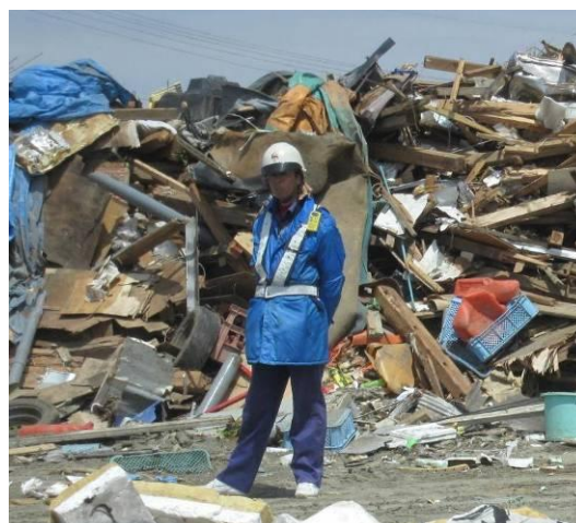
盗難防止のためのガードマン