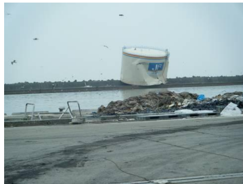
被災地の状況(石巻港)

(2) ガレキの撤去は、128 ある字ごとに順次進めているが、人が住んでいるところと解体される家屋が混在していることから 8 月末に居住地域内のガレキ（家屋）をすべて撤去するということは、仮置場の不足もネックとなっておりなかなか厳しい。8 月末を目標に散乱しているガレキや危険な建物だけでも撤去しようと考えており、現在新たに農地約 76ha の確保に向けて、農協を通じて地権者との交渉を進めている。確保できればガレキの撤去が加速される。石巻市としては 300ha 程度の仮置場があれば良いと考えているが中間処理（県事務委託）の進展の状況次第である。