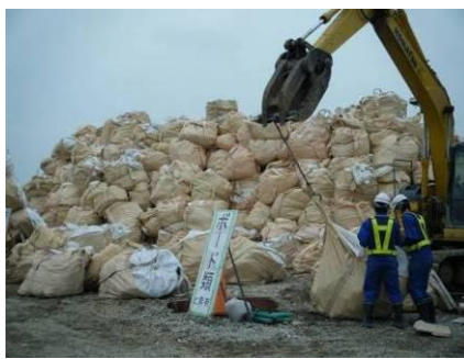
フレコンパックで保管された 石膏ボード(名取市)