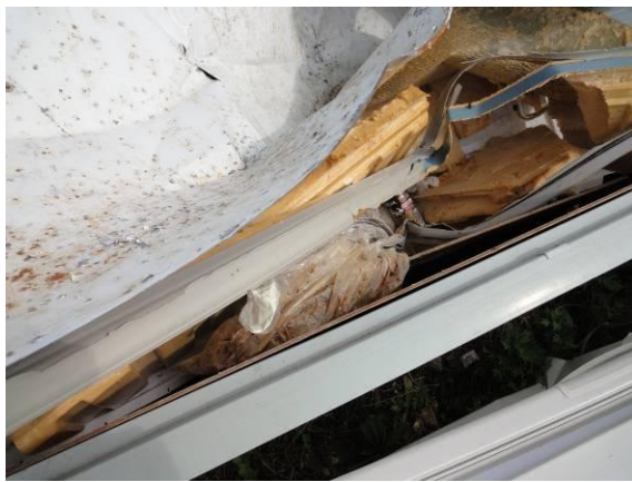
仮置場(冷蔵庫に残っている食品)