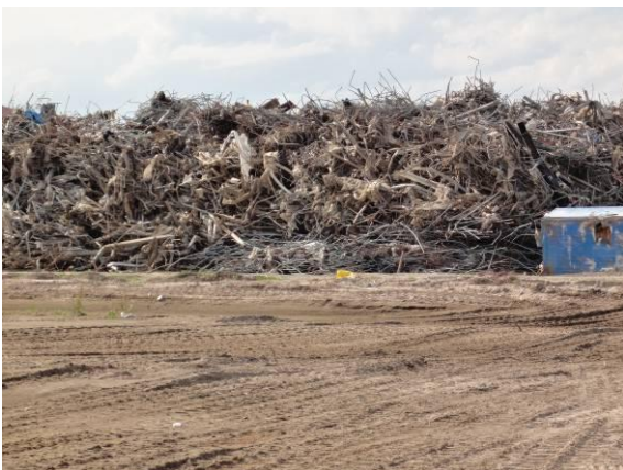
仮置場（山寺字矢来）（一部金属くずを分別）