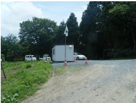
仮置場入口付近に設けられた待機所

宮城県松島町では、仮置場の入口付近に現場作業従事者が待機、休息するためのプレハブ小屋を設置し、水分補給を行うための設備、救急医療器具・薬品及び手を洗う等の清潔維持のための設備を備えています。待機所には安全旗を掲揚して、作業従事者に対して安全作業遵守を喚起しています。加えて、作業現場付近に、直射日光を避けつつ、短時間の休息を取ることと併せ水分補給を行うための設備を設けています。内部には、眼への異物混入、怪我をした際の傷口洗浄のためのペットボトル、ポリタンクの水等を備えています。