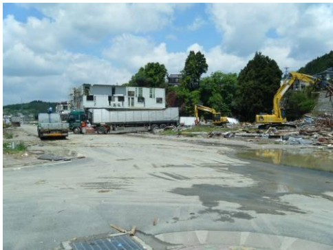
被災港湾施設の撤去作業