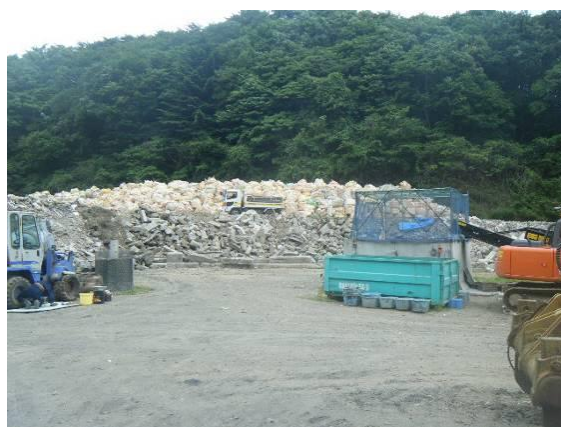
フレコンパックを用いて保管された肥料

なお、飼料、肥料の防湿を図る手段としては、このほか、保管場所の屋根の設置やブルーシート等による養生が考えられますが、この場合、水溜まりの発生防止や強風時における飛散防止のための対策を講じる必要があります。