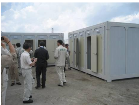
設置予定のシャワールーム