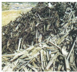
水槽分離された木くず