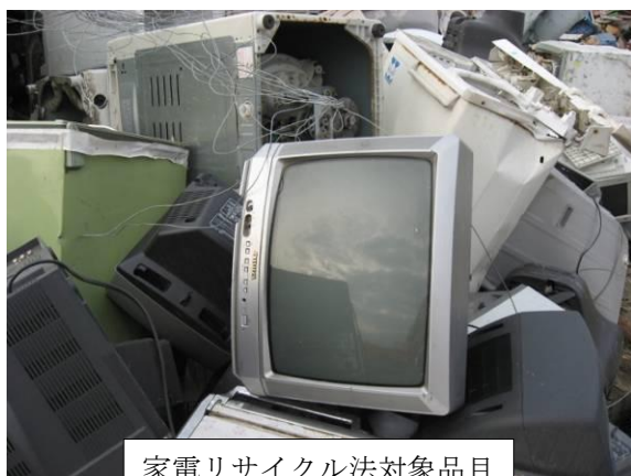
家電リサイクル法対象品目