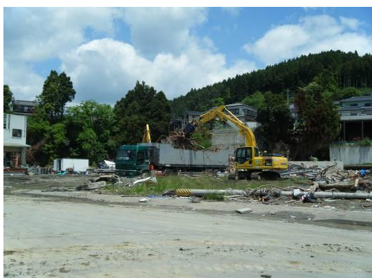
発生現場で直接荷積みされるスクラップ (南三陸町)

宮城県南三陸町などでは、金属類を発生現場で直接荷積みし、早期に売却を進めることにより、仮置場容量の確保を図っています。また、岩手県山田町では、木材チップの搬出先を早期に確保することで、仮置場における廃木材の分別とチップ化を先行的に実施することが可能となり、継続的なチップの搬出が可能となっています。