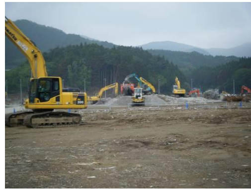
仮置場(コンクリート塊)