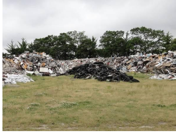
仮置場（新浜町公園）（廃タイヤ）