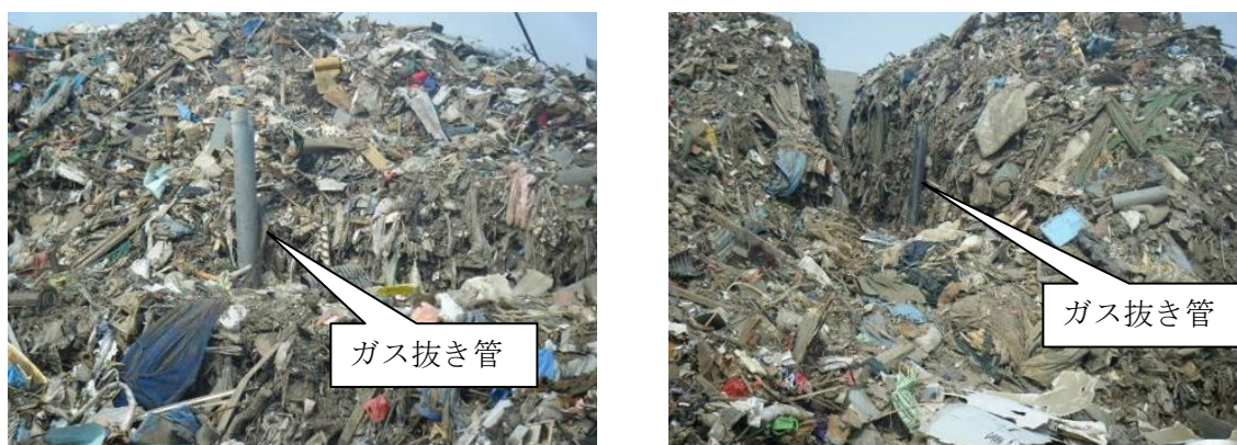
混合物の山に設置されたガス抜き管

宮城県東松島市では、過去の経験を活かし、混合物の山にガス抜き管を設置し、火災の発生の防止に努めています。ガス抜き管は、ガレキの中から回収した塩ビ管を有効利用しています。